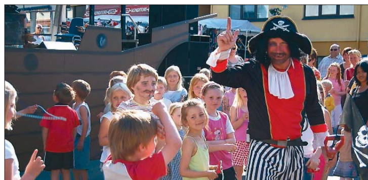
Barna vart aktivisert gjennom ei aktivitetsløype under Sykkylvsdagane,

REIDUN IDLAND VELLE kristin.knudsen@smp.no